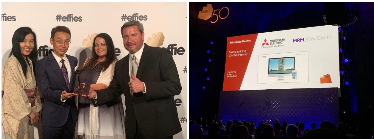
Ceremonia de los Effie Awards (hora local del 30 de mayo de 2019 en Nueva York, Effie US Gala)

TOKIO, 3 de junio de 2019 – Mitsubishi Electric Corporation (TOKIO: 6503) ha anunciado hoy que el sitio web de soluciones de construcción de Mitsubishi Electric US, Inc. ha recibido un premio de bronce en la categoría de empresa a empresa (B2B) de los Effie Awards, un programa de premios internacional que reconoce la excelencia en publicidad. Este año Mitsubishi Electric es el único ganador de la categoría B2B, en la que se cree que es la primera vez que un fabricante de electrónica japonés recibe un premio Effie.