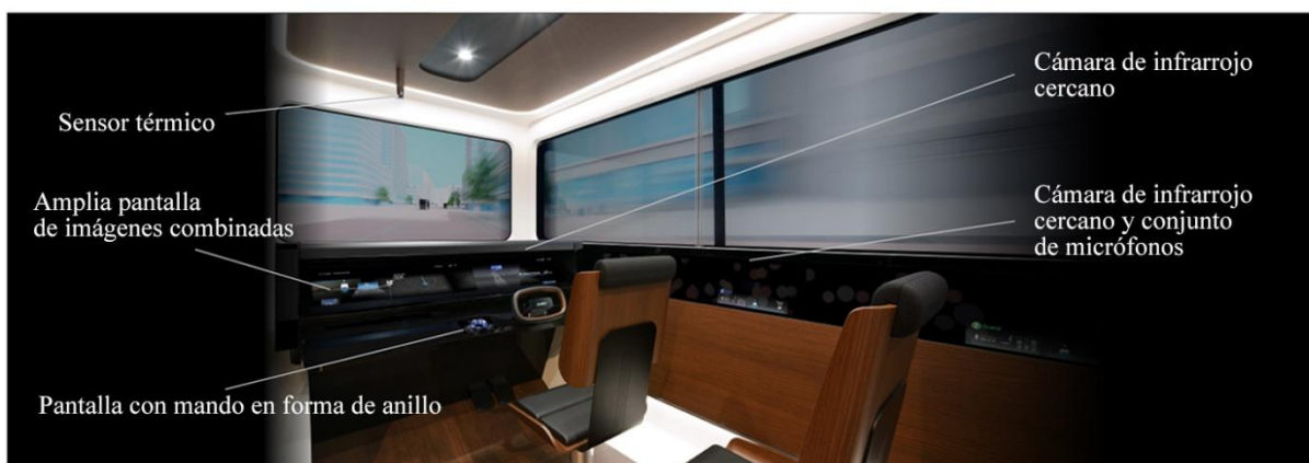
Representación de EMIRAI S

TOKIO, 8 de octubre de 2019 – Mitsubishi Electric Corporation (TOKIO: 6503) ha presentado hoy su prototipo de vehículo EMIRAI S, equipado con tecnologías de vanguardia, como una innovadora interfaz hombre-máquina y funciones de detección biológica, que se espera que contribuyan a la seguridad del transporte, así como a una mejora de la comunicación de los pasajeros para la futura sociedad de la movilidad como servicio (MaaS). El EMIRAI S se presentará durante la 46.ª edición del Salón del Automóvil de Tokio de 2019 en el recinto ferial Tokyo Big Sight, del 24 de octubre al 4 de noviembre.