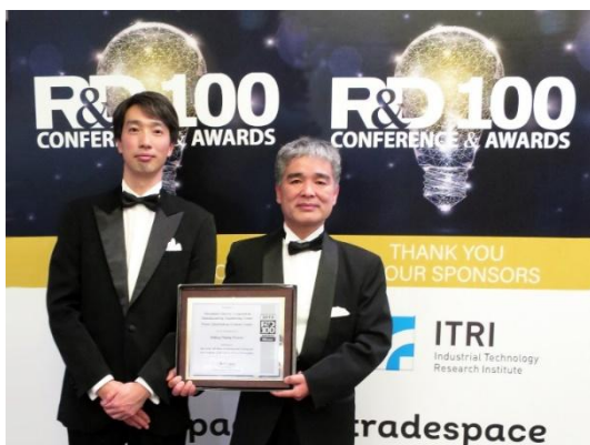
Asistentes a la ceremonia de entrega de premios R&D 100

La galvanotecnia es un proceso que pone en contacto el elemento de destino con una solución de chapado a través de un electrodo, sin requerir un baño de chapado, permitiendo que solo la superficie de contacto se chape mientras se desliza sobre el electrodo.