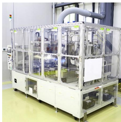
Máquina de chapado con deslizamiento automático pieza a pieza