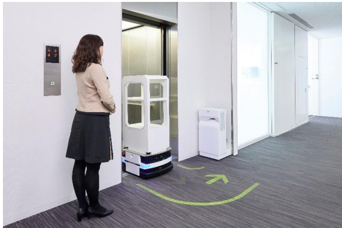
La iluminación animada indica los movimientos del robot móvil del edificio