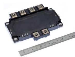
1200 V/400 A 4 en 1 1200 V/800 A 2 en 1