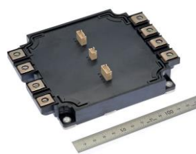
1200 V/1200 A 2 en 1 Circuito RTC integrado